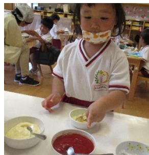
さくらぐみ 袋の中で潰したよ