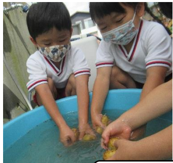
じゃがいも、綺麗に洗うよ

そして、そのじゃがいもを使ってクッキングをしました。給食の先生にじゃがいもをゆでてもらい、ふじ組さんは包丁を使って半分に切り、きく組さんはスプーンを使って潰し、さくら組は袋の中でモミモミ! 各クラス今年初めてのクッキングを楽しむことができました。クッキングしたじゃがいもに、マヨネーズ、ケチャップ、塩をそれぞれ自分好みで選びいただきました。ホクホクのじゃがいもはとても美味しかったですよ。