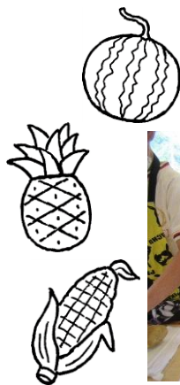
ふじぐみ 包丁をつかったよ