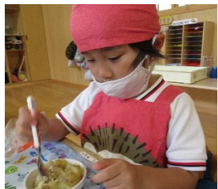
きくぐみ スプーンで潰したよ